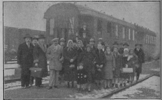
A gyulai ifjúság egyik csoportja az orosházai pályaudvaron.

Aznap este ifjúsági ünnepélyt tartottunk, telt ház és igen nagy érdeklődés közepette. Láttuk, hogy a hallgatóság elégedetten és mosolygó arccal távozott. Éjszakára a különböző barátkozók hajlékaiban nyertünk elhelyezést, hogy