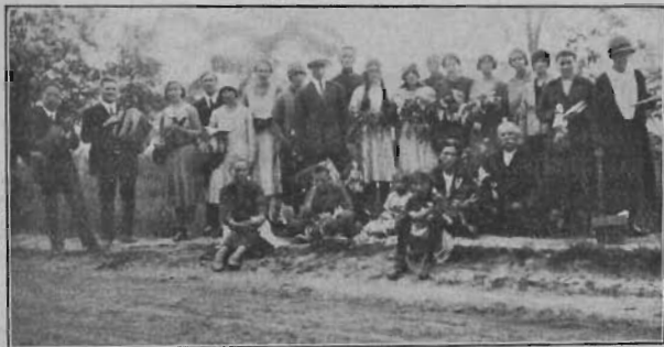
A szigetszentmiklósi kirándulás.

Pünkösöd hétfőjén kirándultunk Szigetszentmiklósrá. Gyönyörű, akácvirágos dunamelletti