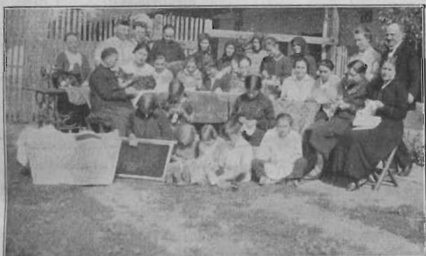
A békéscsabai A) gyülekezet Tábea tagjai munkában.

A kosár egy négyszegletes ruhakosár, 80 cm. hosszú, 45 cm. széles és 32 cm. magas. Benne van egy kis matrac, lepedő, párna és paplan. Azonkívül tartozik minden kosárhoz: 4–6 db pelenka, 3 ingecske és 3 ruhácska.