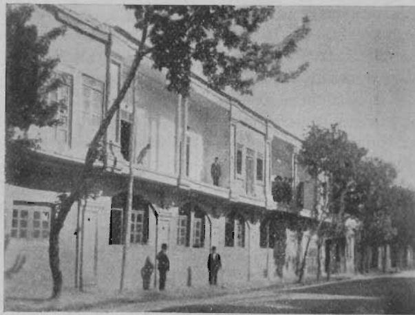
A sultanabadi misszióiskolánk.

és valóban áldásos tevékenységet fejt ki az utolsó üzenet előrevitele érdekében. A legtöbb tanuló mohamedán vallású és az iskola hatása igen látható rajtuk. Kórházunkban a két orvos mellett még egy külföldi ápolónő is működik. Ezek az intézmények a hatóságok előtt igen becsültté tesznek bennünket s üzenetünkkel ők is megismerkednek. Az orvosi missziómunka a mohamedán országokban rendkívül fontos és értékes, mert ezáltal