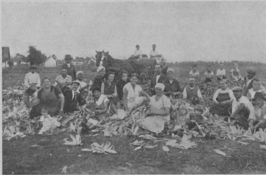
Az orosházi gyülekezet „Tábea“ munkája 1932 szept. 11–14-ig. A 65 órás munka eredménye 20 métermázsas kukorica volt.