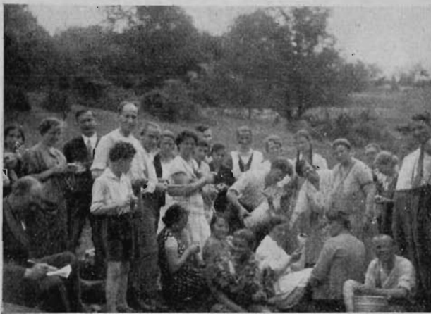
Vidám készülődés az ebédhez.

A környékre tettünk kisebb-nagyobb kirándulásokat is. Szamócát, virágot, meg árvalányhaját szedtünk, lubickoltunk a Balaton hullámaiban. Megnéztük Tihanyt s visszaemlékeztünk a négy évvel ezelőtti első ifjúsági kirándulásra, mely kiindulópontja volt annyi öröme- nek. „Az Úr áldjon meg” visszhangzott Vesze- lovszky atyafi érces hangja, a Tihanyi apátsági templom ősrégi faláról. Az Attila dombról szét- tekintve délfelé a gejzirkupokat, szökelő hőfor- rások maradványait és a Belső tavat, mint Tihany geológiai érdekességeit láthattuk. Meg- tekintettük az avar sáncokat, melyek a népván- dolás első hullámainak emlékét őrzik. A hatalmas patkó alakú sánc, nagy szekértábor vé- delmét nyújthatta és a sok könny és vér ön- tözte fensikön Jézust