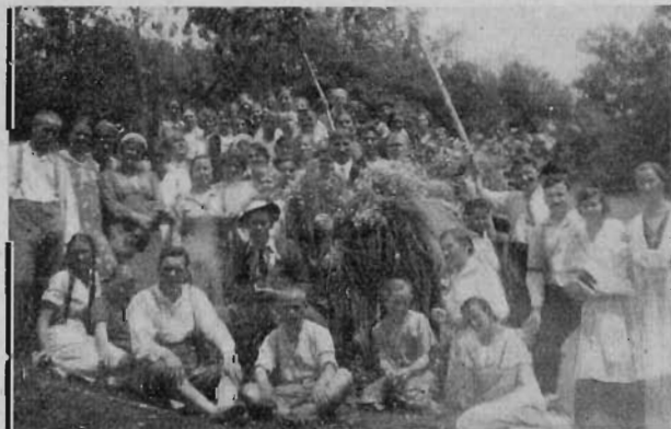
Zeiner atyafi fogadtatása.

Tovább haladva a csodaszép erdei ösvé- nyen, a Ciprián forrás mellett vitt el útunk, majd a híres kecskeköröm lelőhelyére mentünk, hogy