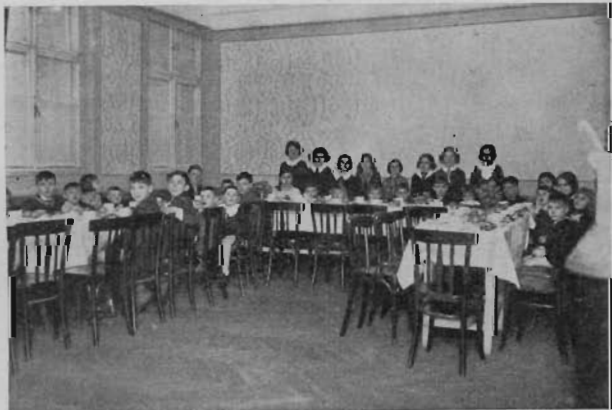
Budapest „Á” gyülekezet gyermekerege, mint a Tábea egyesület vendégei.

Az ünnepély a nagyteremben volt, melyre a testvéreket is meghívtuk. Az üdvözlő beszédet alulírott mondotta. „Mit ér az ima, ha szeretet és cselekedet nem kíséri azt.” Ez volt a beszéd mottója. Az erkölcsi sikerhez hozzájárultak a gyerekek is. Nekünk adventista szü-