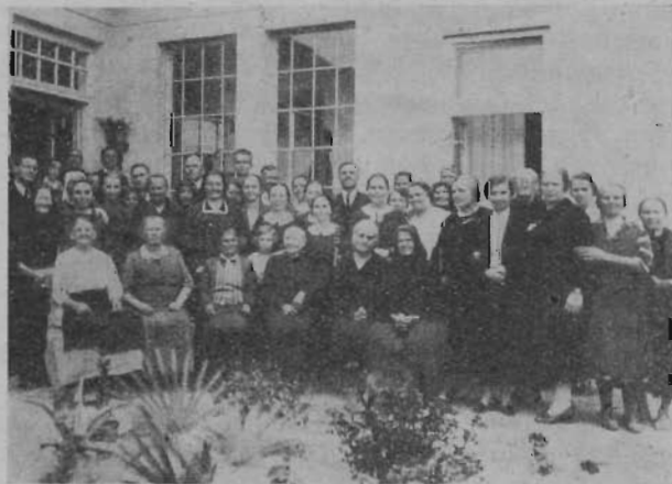
Az ünnepség résztvevői