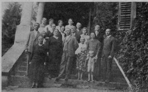
Az Öregek Otthonának személyzete.