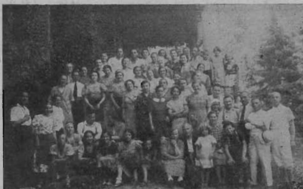
A kiránduló ifjúság Vattán.

Havas csúcsai távolról intettek felénk s mi örömmel gyönyörködtünk benne.