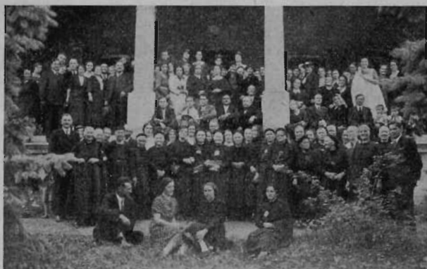
Együttes kép a nagy feljárat előtt.

Az odaszentelő ima szavai alatt a hála, öröm és meghatottság könnyei egybeforrasztották a vendégeket, a testvéreket, az öregeket és prédikátorokat. Ekkor olyan pont következett, ami nem volt benne az istentiszteleti sorrendben: felállt vitéz Buttykay Béla ezredes szék-kapitány és a következő kijelentést tette: „Mélyen tisztelt Hölgyeim és Uraim! Az emberbaráti szeretet gyakorlásának célkitűzése: a legnemesebb feladat. Ezen ősi előkelő kastély falai között nem lehetne szebbet, igazabbat alkotni, mint amit az adventisták tettek. Én, aki hazafias lélekkel vettem részt ezen ünnepélyes megnyitáson, kijelentem, hogy mindenben épültem. Ezért hazánk első erkölcsi testületének nevében azt kívánom, hogy az Önök kiváló elnökük és a nemeslelkű lelkészi gárda továbbra is így vezesse felekezetiüket és akkor a Vitézi Rendet mindenkor maga mellett fogja találni.” Mély hatást gyakoroltak e katonás szavak az egybegyűltekre. Michnay testvér így köszöntö meg: Méltóságos Uram! Boldogan hallgattuk Méltóságod elismerő szavait. Köszönöm a magam, a prédikátorok és népünk nevében. Gondunk lesz arra, hogy amiket mondani méltóztatott, azt minden adventista testvérünk olvassa és így e nemes szavakat szívébe zárja.