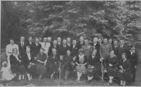
Vitézi Szék, hatóságok, újságírók és prédikátorok csoportja.

punkban a sok értékes gondolat felsorakoztatása, ha szószerint közölnénk hálaadó szavainak összességét. Azért csak kivonatossan közöljük az elmondottakat: „Amikor Jézus Krisztus itt járt a földön és Egyházát megalapozta, akkor két megbízást adott követőinek: