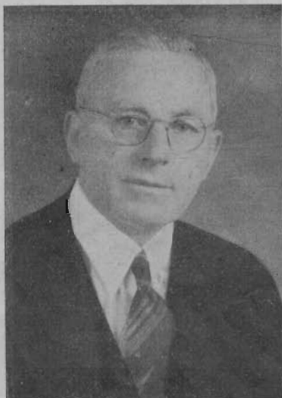
Strahle J. J. K. E. vezető

Aldja meg a Mindenható őket velünk egyetemben, hogy ők mind jó tanítók, mi pedig mint