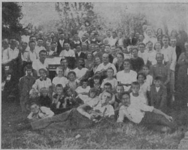
A békési és bcsabai ifjúság.

Augusztus hó 21-én gyönyörű napsütéses reggelre virradtunk, mit hálás köszönettel vetünk mennyei Atyánktól, mert az egész hónap, pár nap kivételével borús-esős napokkal telt el. Ez megkétszerezte szívünkben az örömet, hogy a kéklő égen arany napsugarak omlanak az egész határra és éreztük a lágy szellők símogásából, hogy nagyon szereti az Úr minden teremtményét. Sietett is mindegyikünk, hogy a nagy természet templomában először is szívünk háláját Urunk dicsőségére együttesen elmondhassuk és szíveinkben hozott örömeinket egymás között megoszthassuk. D. e. 9—10-ig áhítat volt; 10—11-ig ártatlan szórakozás és ez alatt pedig szorgoskodtak az ebéd elkészítésével a jókedvű szakácsok. 1—2-ig volt az ebéd 3—5-ig volt az ünnepléy ; szépszámmú idegen hallgatóság is részt vett áldásos óráinkon. A képen látható az aratás által szerzett 700 pengős harmónium. Minden örömünk az Úrtól van, ezért legyen minden dícséretünk az ég és föld Uráé. Halász Lajos.