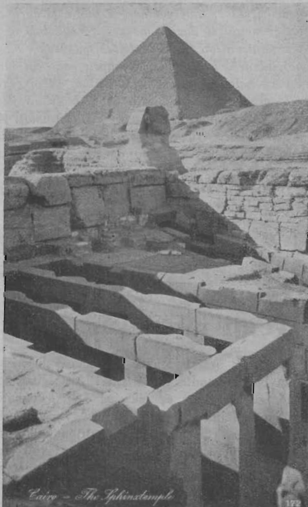
Szfinksz. Mögötte óriási piramis. Előtte kisebb lehordott piramis belseje.

Közös ének és imádság után így kezdte el: „Az elmúlt hetekben valóban nagy kegyelemben lehetett részem, hogy Egyiptom fővárosában, Kairóban a Divízió Bizottság ülésén résztvehettem. Dávid tapasztalata lett az én tapasztalatom. A 113. Zsoltár szavai mentek az én életemben valóban teljesedésbe. Ha elgondolom, hogy még csak két évtizeddel ezelőtt is a pusztulás útján jártam, porban és sárban, mint halálra érett bűnös, akin semmilyen emberi hatalom sem segíthetett már, akkor hajolt le hozzám az Úr és mint egy útszéli sebesült vándort: felemelt, megtisztított, elhívott, hogy aki addig a világnak és az ördögnek szolgáltam, ezután le-