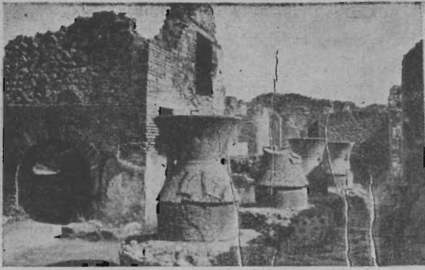
Pékműhely és örlőhelyek Pompeiben.

akar magának alkotni arról, hogy Isten ítéle te elől senki el nem menekülhet, az nézze meg Pompei romjait. (1. Thess. 5, 3.) Pompei kb. 40.000 lakosú, előkelő, gazdag város volt. Kereskedők, bankárok és mágnások városa. Pénz bősége, gondtalan élet irtózatos bűnökbe sodorta. (Ezékiel 16, 19.) Pompei az örömök városa volt. Gyönyörű házai némelyikében még ma is látható a díszes festmények és a nagyszerű berendezések páratlansága. Azonban nem mentette meg sem gazdagságuk, sem előkelő voltuk. Ugy, ahogy voltak: mind ottvesztek. Sohasem értettem meg annyira az Úr Jézus szavait (Máté 24, 37—39.), mint ekkor. Ott is, minden élet a rendes mederben folyt, mikor nagy hirtelen jött a világ pusztulása. Így volt Pompei életében is!