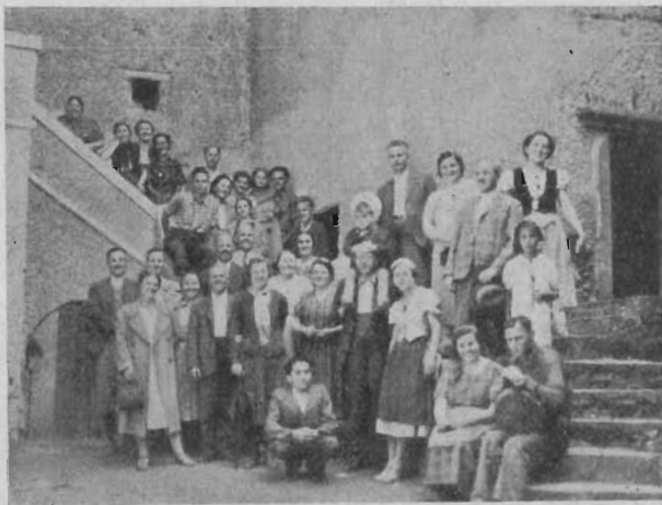
Pihenés Krasznahorka várában.

Július 2-án reggel indultunk a Keleti pályaud- varra. Mosolygó arccal, boldog hangulattal gyüle- kezett a táborozásra induló sereg. A Magyar Állam Vasút vezetőségének előzékenységéből külön kocsit kaptunk a végállomásig. Vasárnap estére együtt volt az ország minden részéből összesereglett tábor. Megtelt a menedékház földszintje, padlása és ve- randája. A környékező szép erdőben kacagásunk és énekünk 10 napig felverte a fenyves-erdők csendjét. A nagy, pázsitos játszótéren a fiatalság futkározott a játék óráiban. Mellette gyűltünk ösz-