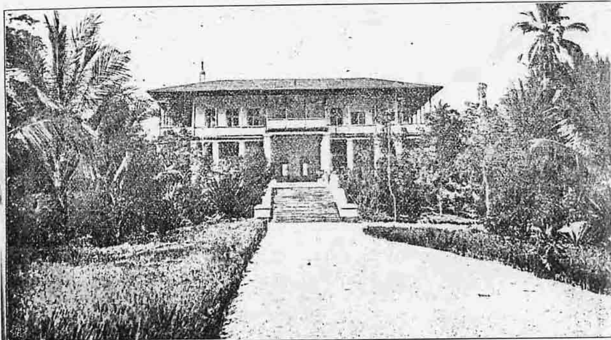
Helytartósági épület Dar-es-Salaamban.

A Vörös tenger mellett is elmentek, melyről azt írták: »Amit itt láttunk, az nagyon érdekelt bennünket. Ama kes-