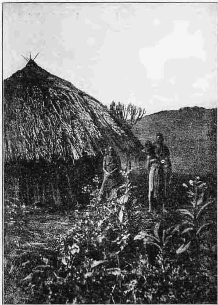
Egy bennszülött kunyhója a Pare-hegységen.

lásban nagy előrehaladást tesznek, úgy a praktikus testi munkákban is. A tíz parancsolatot könyv nélkül tudják. A tőlünk írt verseket is jól tudják énekelni és írásban, számolásban néhány kis mester van köztük. Ha enni akarnak, fölállnak és az öregebb elmond egy rövid asztali imát. Bátoran mondhatjuk, hogy ők szeretettel csüngenek rajtunk és azt mondják, ne menjünk Uleira.