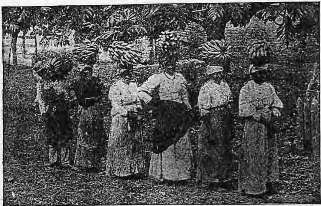
Bananát hordó asszonyok Jamaika szigetén. (Lásd a 164. old.)

lehetne? Dacára annak, hogy ezen eszmék megvalósulása igen kívánatos volna, s saját szavaik szerint is végre itt volna már az ideje, hogy az ezeréves békebirodalom hajnala békétlen világunkra hasadna, — mégis egy bele-