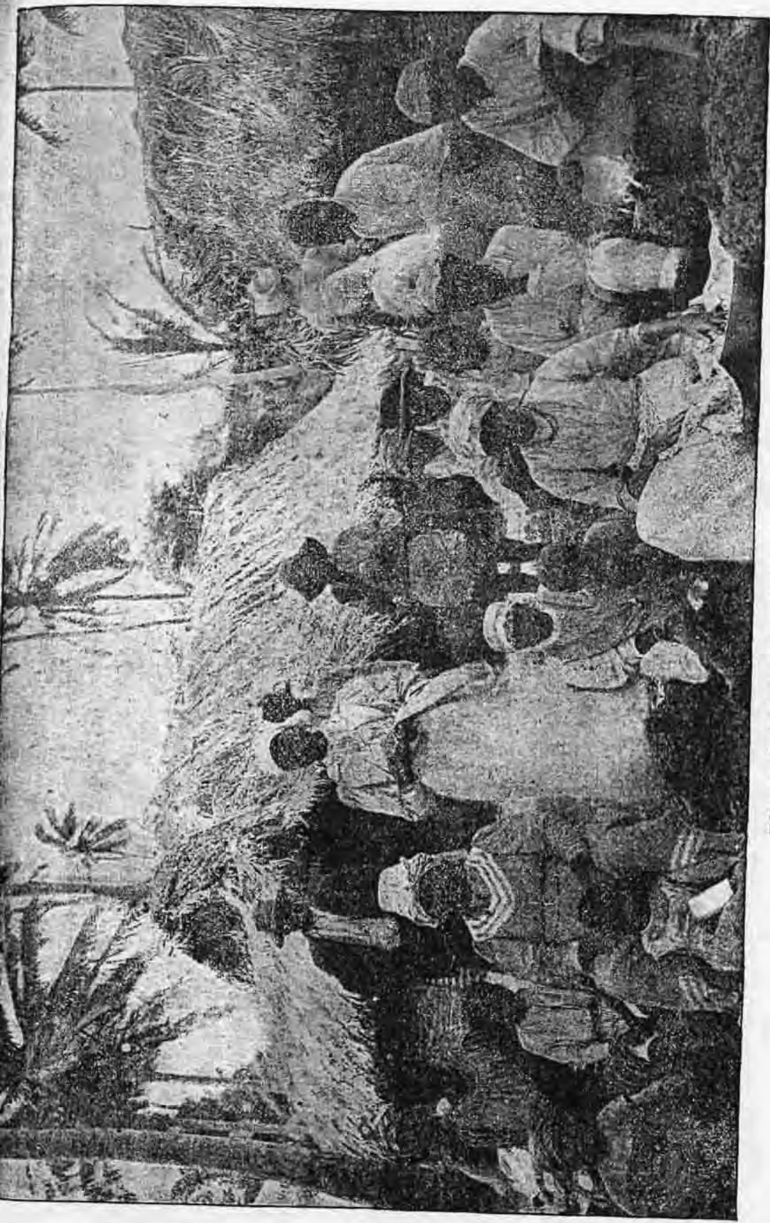
Pálmaszalmával fedett házak Jamaika szigetén.