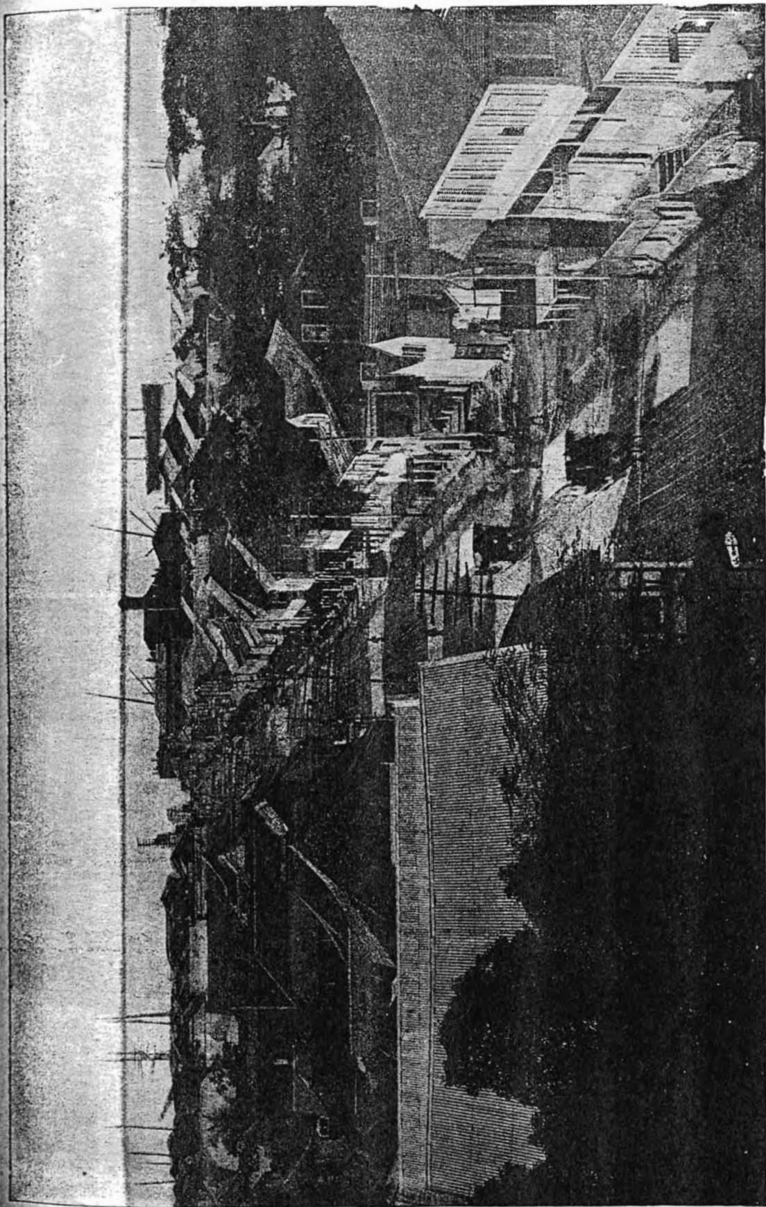
Kingston (Jamaika) a földrengés előtt.