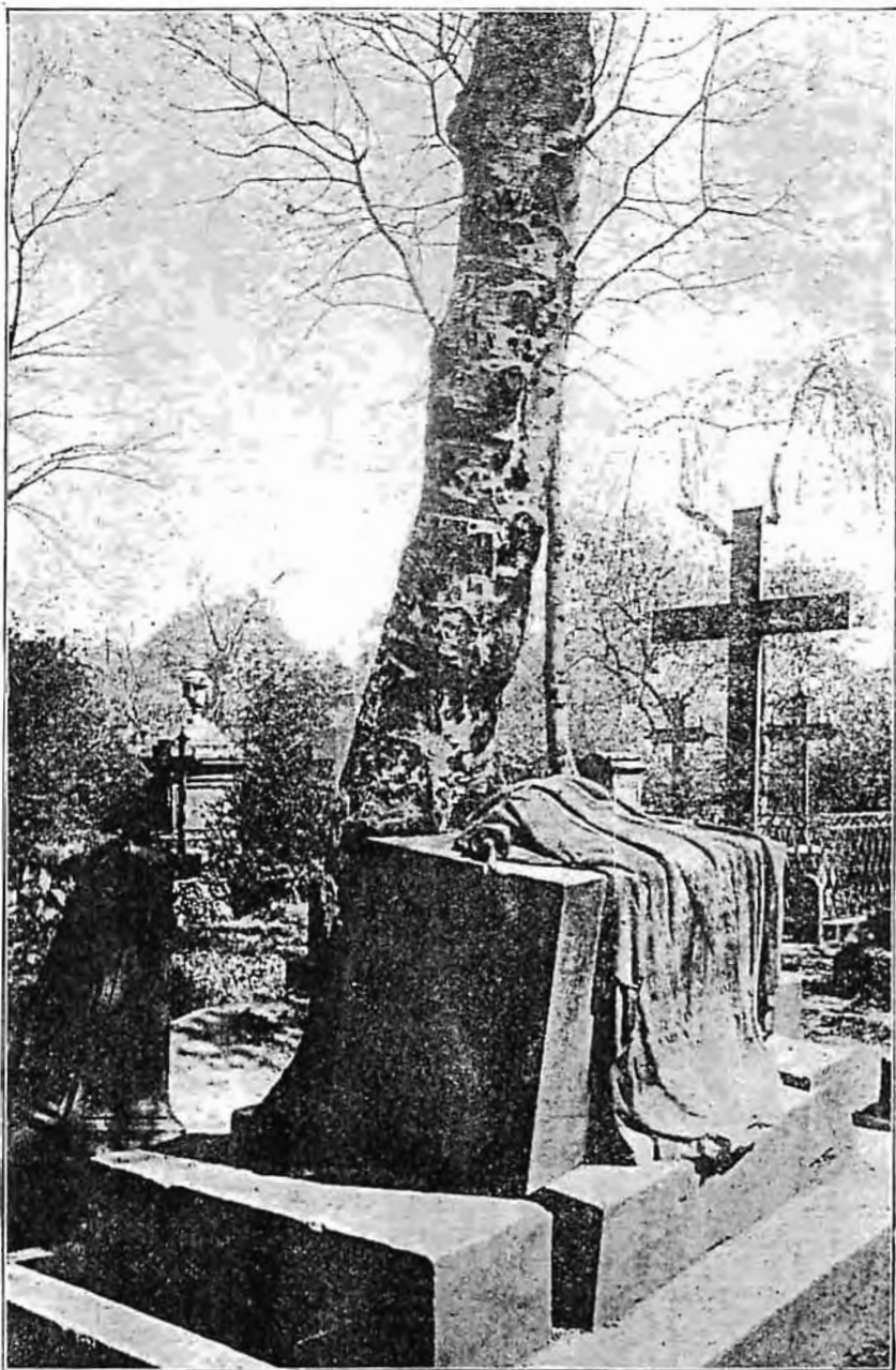
Nyílt sír Hannoverben (Németország).

egy körülbelül 15 métermázsás követ állítottak, amelyre az volt írva: »Ezen sír örökre be van zárva és nem lesz nyitva soha többé.« A dolog azonban másképp jött. Egy kis jegenyefa magja valahogy belekerült a kövek alá a sír belsejébe