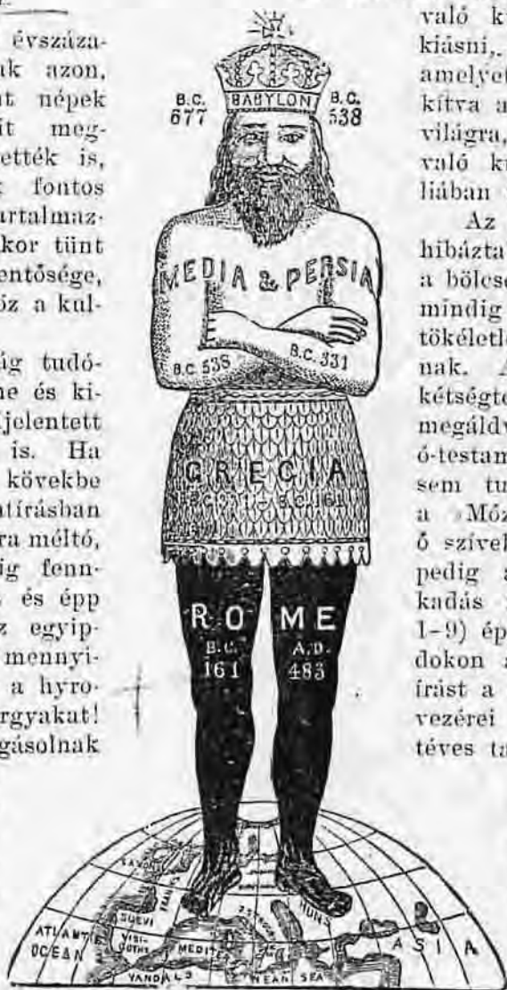
A nagy kép Dán. 2. r.-ből.

Az emberek eddig abban hibáztak, hogy ahelyett, hogy a bölcsesség kincseit keresnék, mindig csak hibák és emberi tökéletlenségek után kutattak. A régi Izráel, amely kétségtelenül tehetséggel volt megáldva, midőn olvassa az ó-testamentomat, mai napig sem tudja megérteni, mert a Mózes fedele vetetik az ő szívekre. A keresztyénség pedig a hittől való elszakadás folytán (2 Thess. 2, 1-9) épp úgy járt. Évszázadokon át elvonták a szentírást a néptől. Maguk a nép vezérei a hagyományok és téves tantételek világosságában vizsgálták a bibliát. Isten éltető beszéde helyett mindenféle legendákat és meséket terjesztettek el. Ez oknál fogva adatik most a végső időre azon ígélet, hogy a pro-