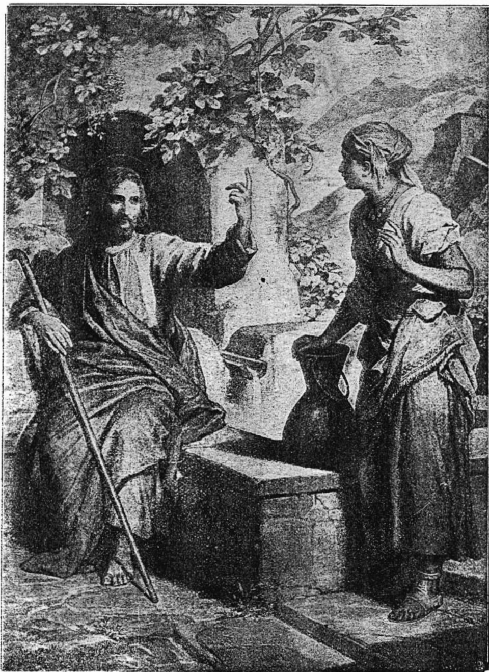
Jézus és a samariabeli asszony.

akarak tölteni téged avval, hogy te is az élő víznek egy kútforrása lehess, melyből szomjuhozó embertársaid meríthetnek. Ők is áldásban fognak részesülni általad,