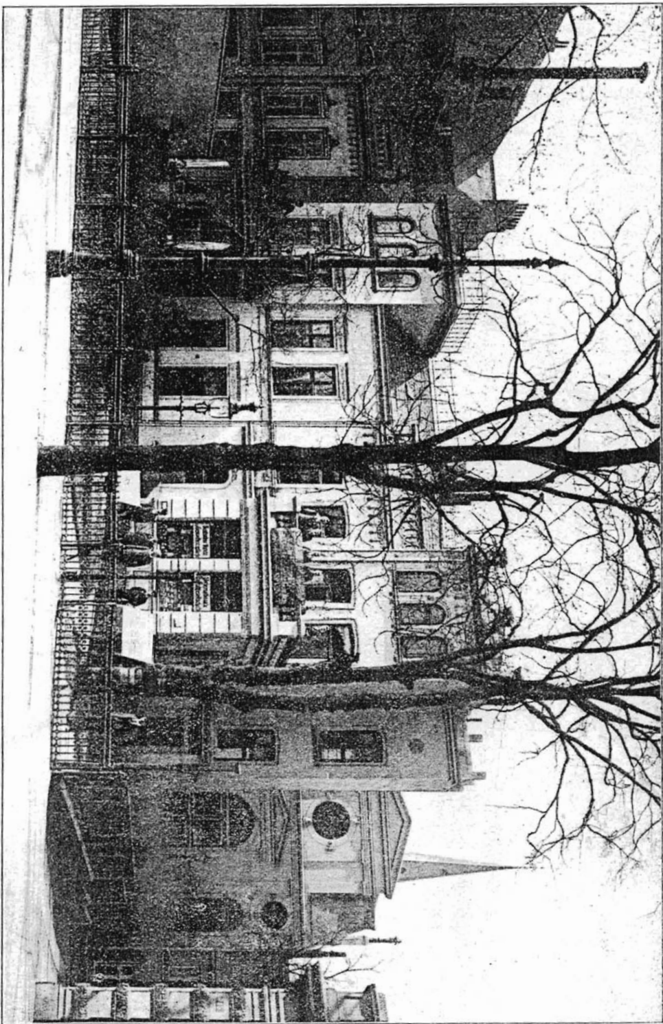
A mi misszió-házunk Hamburgban.