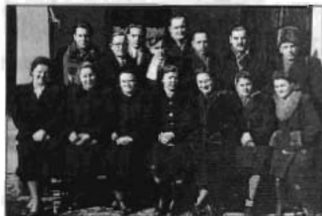
Az Advent kamarakórus, 1947