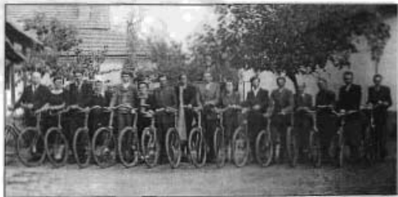
Békéscsaba. Népevangélisták Kesjárék udvarán, 1947