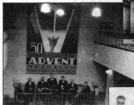
Balra: a magyarországi advent-misszió 50. évfordulója