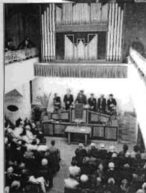
A Székely Bertalan utcai kápolna orgonája 1968-ban épült