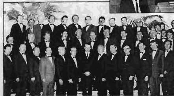
Balra: Az 52. generál konferenciai ülés magyar férfikórusa, 1975.