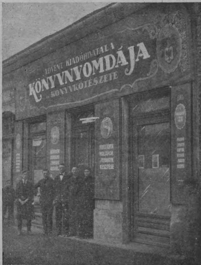
A nyomda. Ujpest, Árpád-ut 21.

dalával, az Evangéliumi Munkást s egyéb nyomtatványainkat is. A gyorsajton kívül még két gép áll a gépteremben. Ezeket tégelyes gépeknek nevezzük. Ezekon kisebb nyomtatványokat, mint például könyvek borítékait, röpiratokat, levélpapírokat és borítékokat állítunk elő. Ha a folyóirat revízió példánya visszaérkezik a szerkesztőségből,