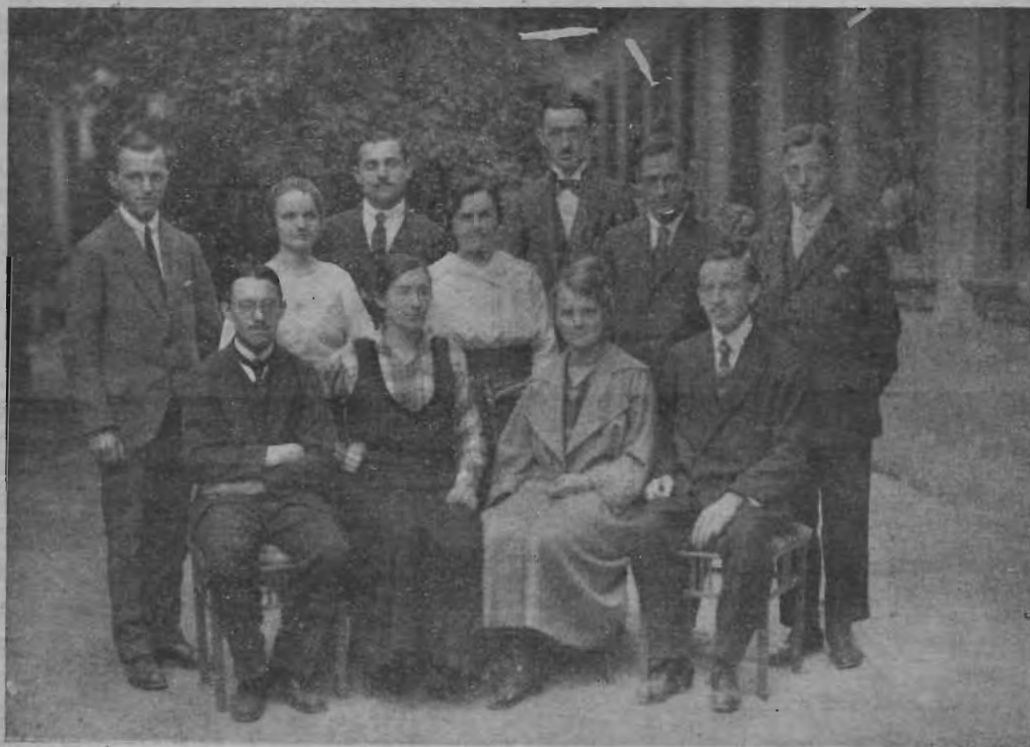
A kiadóhivatal és nyomda személyzete.

kellene könyveinkből kiáradni, hogy a jelenvaló igazság tekintetében beragyogják az egész világot. A 68. zoltár 12. verse a Károli féle magyar bibliában a következőképpen hangzik: „Az Ur ad vala szólniok az örömhirtívő asszonyok nagy csapatának.“ (A héber eredeti szöveg szószerinti fordításban így hangzik. „Az Ur adta az ígét. Igen nagy a serege a hirnőköknek.“) A hirdető asszonyok, vagy a hirnőkök alatt pedig képletesen azoknak a könyveknek és röpiratoknak az ezreit kell értenünk, melyek az isteni igazság öröm-