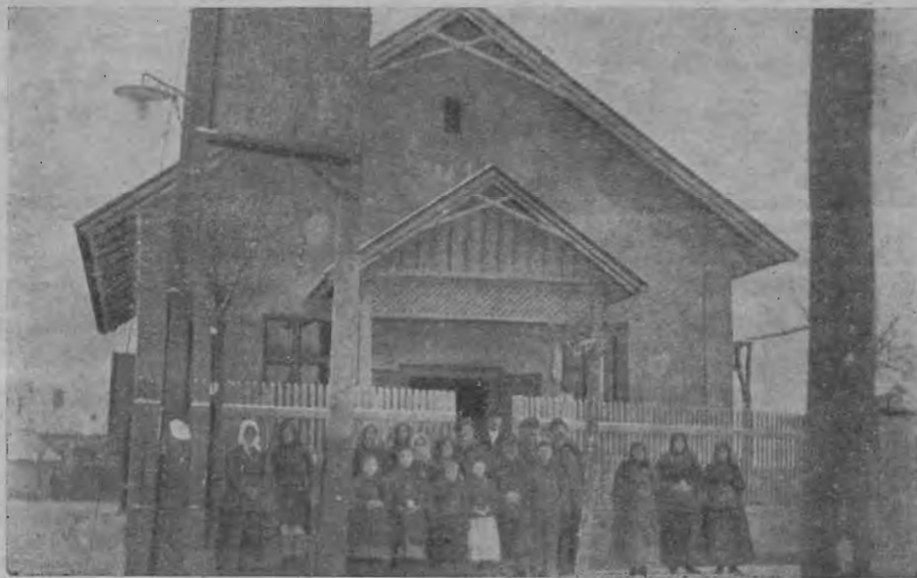
Az új imaház Békésen.

A szent beszéd után következett a fölszen-