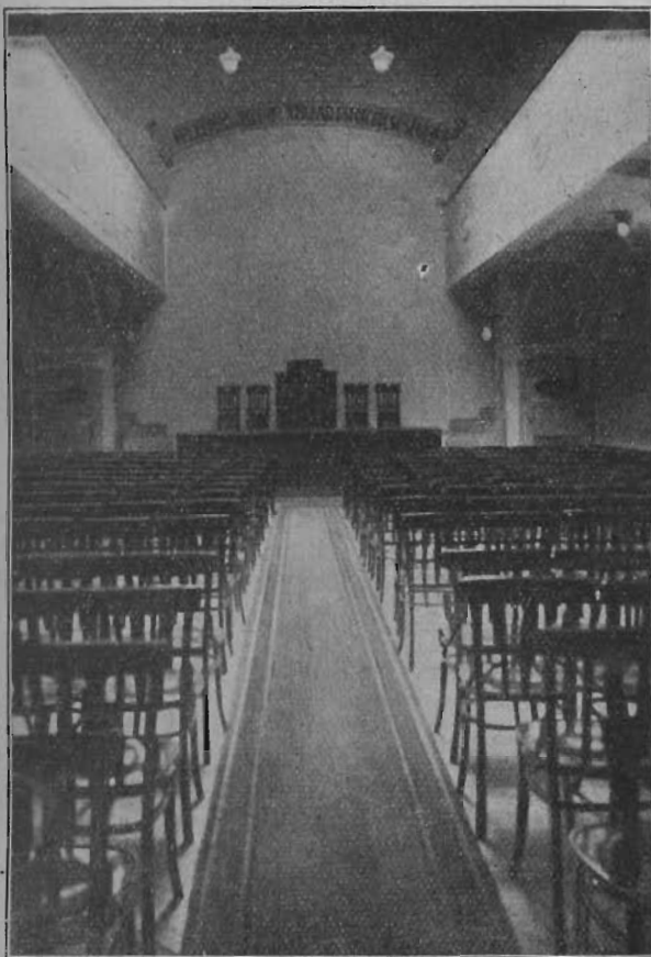
Budapesti kápolnánk belseje.

Pest-Pilis-Solt-Kiskun-, Csongrád-, Fejér-, Komárom-, Esztergom-, Nógrád-, Baranya-, Tolna-, Somogy-, Zala-, Vas-, Sopron-, Moson-,