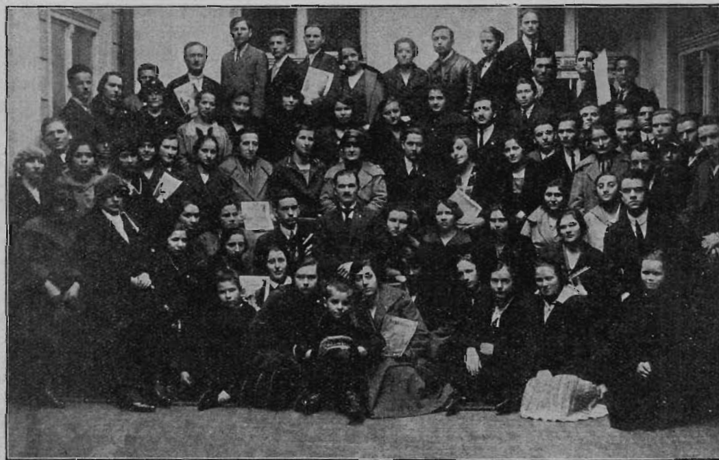
Középmagyarországi terület konferenciáján résztvevő ifjúsági egyesület.

Ifjuságunk 1925-ben az egész Unióban kivette részét a munkából; a konferenciákon leadott jelentésekből látszik ez. De céljainkat most újra emelni kell, a tavalyiakkal nem elégedhetünk meg; az erkölcsi, lelki, szellemi téren a misszió munkában feljebb még magasabb színvonalra kell törtétnünk, hogy legyen ifjuságunk az, aminek az Ur szánta: «Az Ur az ifjuságot segítőkezéül választotta!»