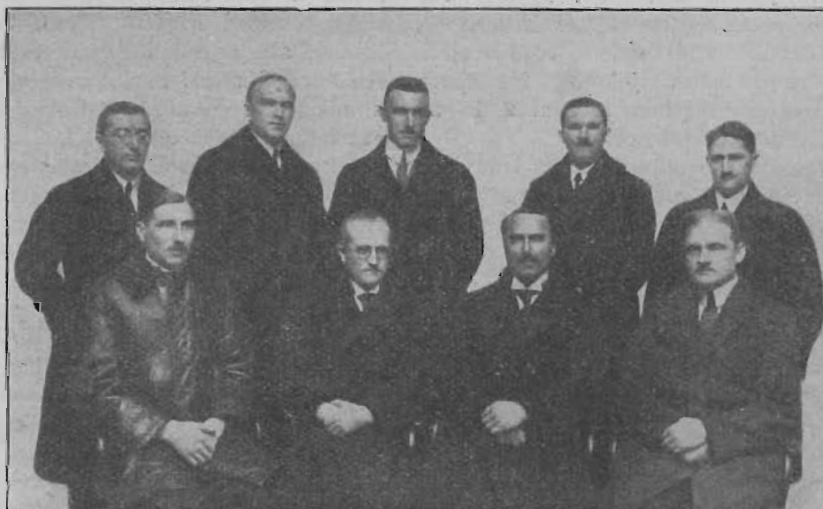
A magyar Unió bizottsága.

A keletmagyar egyesülés 96 s a középmagyar egyesülés 106 új taggal gyarapodott. A múlt év pénzügyi viszonyainak átvizsgálása arra indít bennünket, hogy hálát adjunk a mi mennyei atyánknak, aki a legnagyobb szükség idején sem engedi, hogy megszégyenüljünk. Ezenkívül hála és elismeréssel adózunk