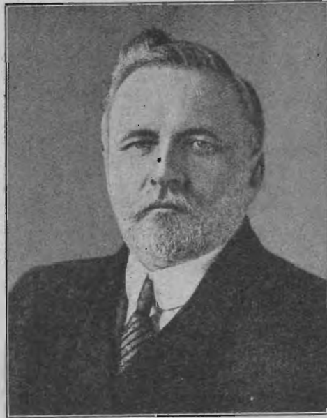
Spicer atyafi, a generálkonferencia elnöke.

«Tanácsnak és hatalomnak lelke, az Ur ismeretének és félelmének lelke.» Mennél nagyobb az értelem és tudás, annál nagyobb a hajlandóság, hogy a hasznosítható tanácsok világosságában járjunk. Az Ur adta meg nekünk szervezetünk formáját s mindenki, aki hivatalos felelősségeket hord, részesül a testvérek tanácsában. Van tekintélye Isten gyülekezetének. Azonban nem egy ember értelme uralja a szervezetet bármely ágát a gyülekezeti vezetőtől számítva a konferencia elnökéig, hanem a tanács tekintélye. A tanácsok megfelelő testülete vagy bizottsága ad tanácsot, Isten félelmében van tehát legyőzhetetlen tekintély Isten gyülekezetében. A jövődőlés lelkének tanácsát jó, ha mi tisztviselők megszívleljük: «Ne zárjuk el értelmünket a tanács elől. Terveinkben, melyek által a művet előrevisszük, értelmünket egyesítenünk kell. Kedveljük a bizalom lelkét