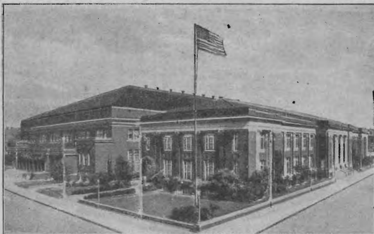
Milwaukee város által rendelkezésünkre bocsájtott tanácskozó-épület.

szükségek fedezésére és új intézetek létesítésére szükséges anyagiakat előteremteni, több misszionáriust kiküldeni, fiatalágunkat az Isten félelmében az evangélium szolgálatára nevelni, több és több nyomtatott üzenetet terjeszteni, az orvosi missziót kibővíteni, Istennek Lelke nagy és meggyőző erővel beszélt az atyafiak szívéhez, megmutatva az egyedüli utat, mely célunkhoz elvezet. Nagyobb átadás, teljesebb önfeláldozás és Jézus Krisztusnak egész szívvel való szeretése, az, ami győzelmel biztosít a kicsiny és különös