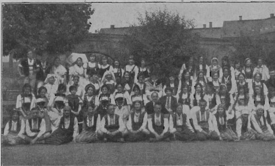
A kongresszuson résztvevő 26 nemzet képviselői nemzeti viseletben.

Senki kiküldöttek között nem bánta meg azt, hogy kiment. Mi csak azt saj-