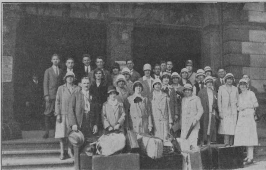
Megerkezés a chemnitzi pályaudvarra.

Szerdán reggel volt a tulajdonképeni megnyitás a kereskedők házában 3500 ülőhellyel bíró nagyteremben, amelyet az összes mellékhelyiségekkel