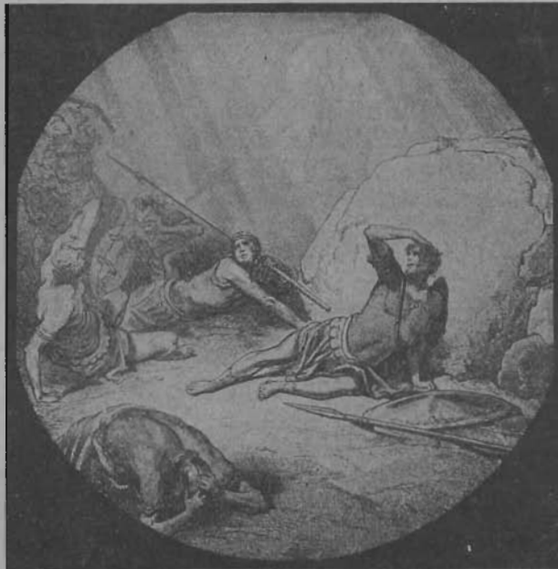
A damaszkuszi úton kapott látomás hozta létre Pál életében a döntő fordulatot. Azóta nevezik „pálfordulásnak” az ember életének hirtelen irányváltását.

Az „én” nem bírja elviselni azt, ha az ő jelenlétében másokat megdicsérnek, ha elismerő-