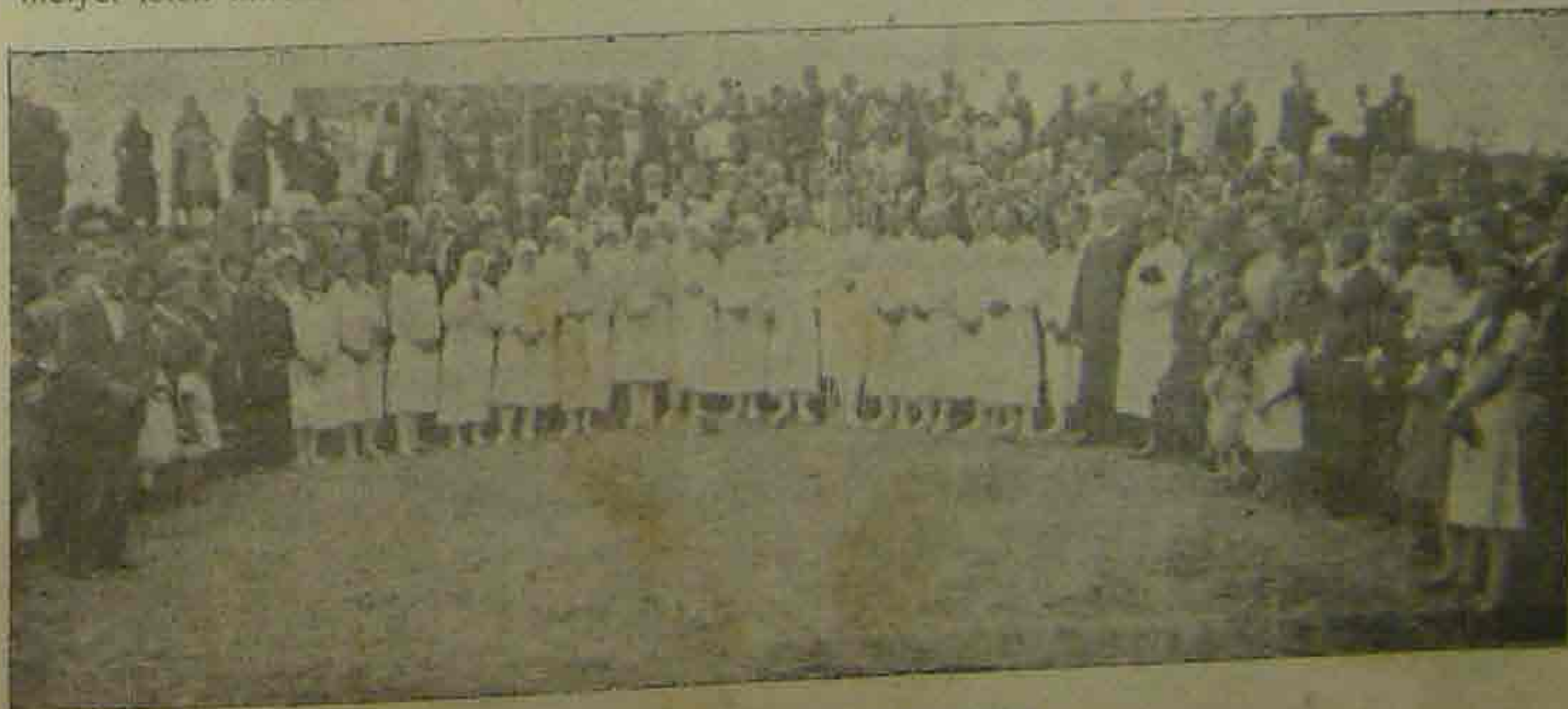
Vizkeresztiség a Dunán.

Kedveseink, tudatni óhajtunk benneteket a