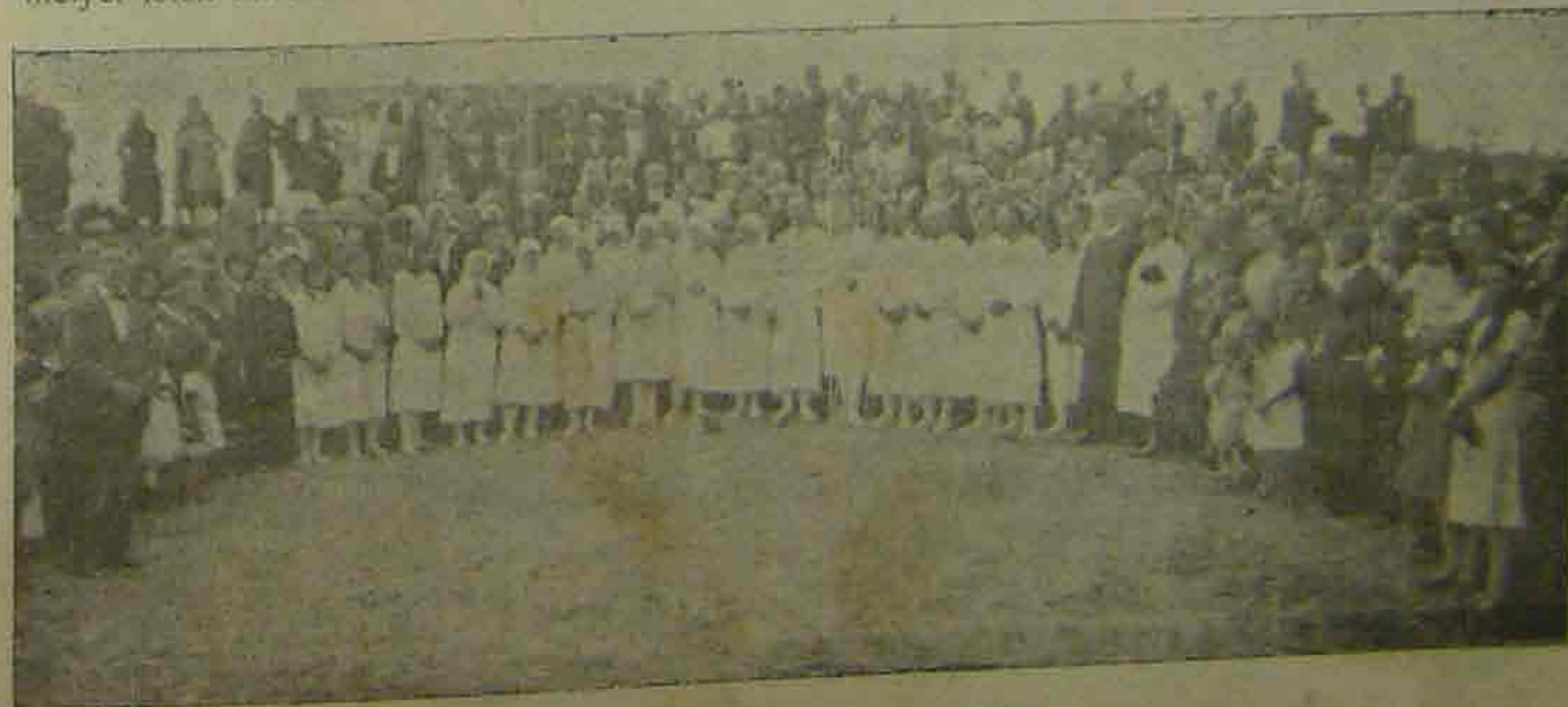
Vizkeresztiség a Dunán.

Kedveseink, tudatni óhajtunk benneteket a